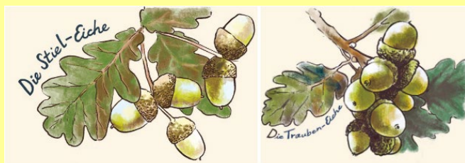
Zeichnungen: Friederike Rave

Noch ist der Herbst in vollem Gange und es gibt viel buntverfärbtes Laub zu sehen. Eichenbäume sind im Vergleich recht lange grün, erst spät werden die Blätter braun, und der Beginn des Laubfalls bei Stieleichen im November gilt als phänologischer Winteranfang (siehe nächste Seite). Stieleiche und Traubeneiche heißen die beiden heimischen Eichenarten hier bei uns. Benannt sind sie nach dem Wuchs der Früchte: Bei der Stieleiche sitzen bis zu drei Eicheln an einem langen Stiel, bei der Traubeneiche viele Eicheln als Traube direkt am Zweig. Bei den Blättern ist es umgekehrt: Die der Traubeneiche sind gestielt, und die der Stieleiche haben gar keinen oder nur einen ganz kurzen Stiel und am Blattansatz Ausbuchtungen, sogenannte „Öhrchen“.